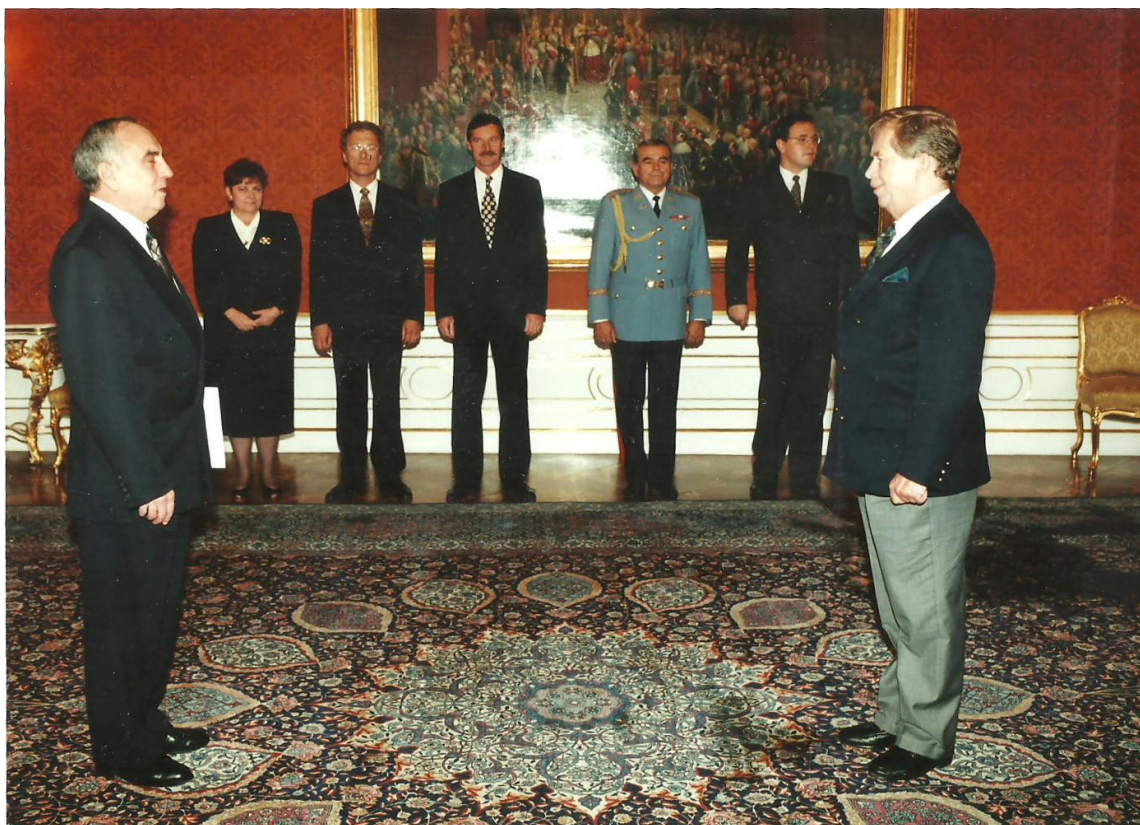
Velvyslanec Vulpășin při předávání pověřovacích listin prezidentu Havlovi v roce 1997