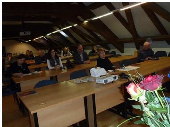
Pohled do sálu