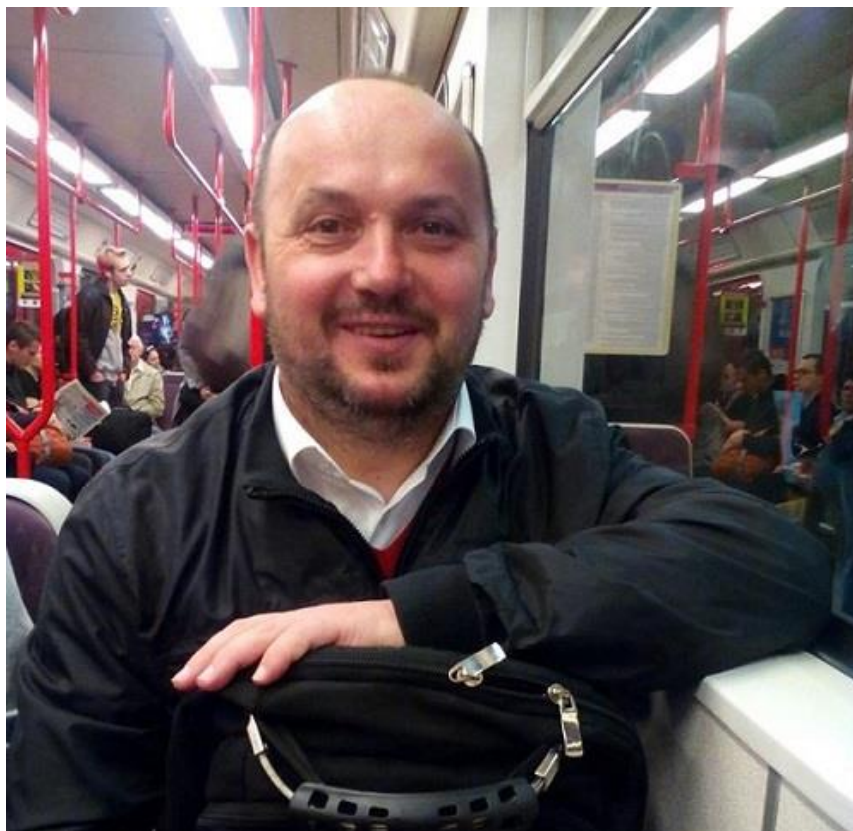
Moldavský spisovatel Dumitru Crudu v pražské tramvaji