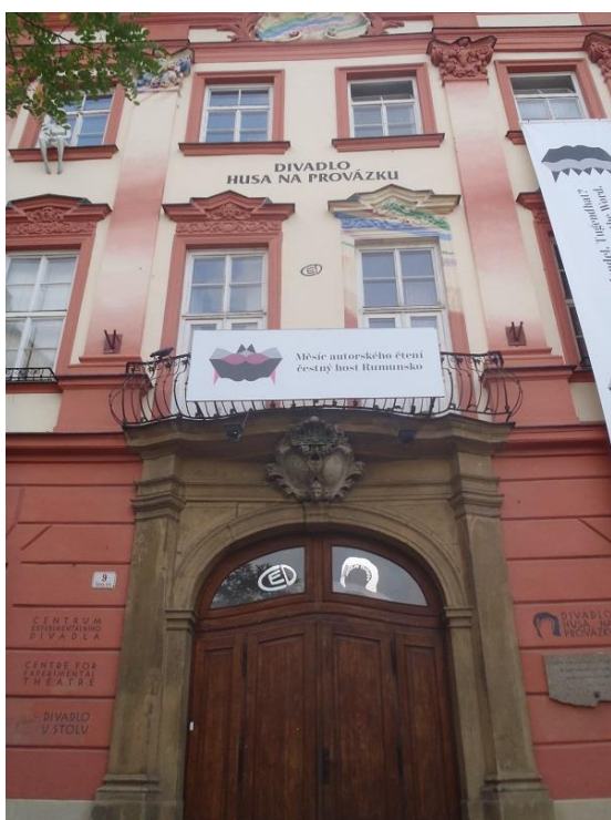
V Brně se festival konal v divadle Husa na provázku.